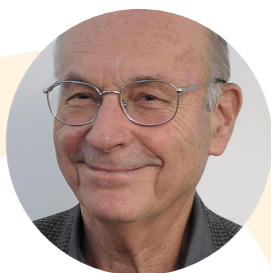
Boris CYRULNIK Ambassadeur de la JIVEP Neuropsychiatre et éthologue

« Depuis que Sapiens est apparu sur la terre, les êtres humains n'ont cessé de se faire la guerre. Il y a 300'000 ans, on s'entretuait parce qu'on n'avait pas le même langage, la même manière de construire les abris ou le même maquillage. Ces différences méritaient la mort, n'est-ce pas ? Il y a quelques milliers d'années, les cités-États d'Assyrie levaient une armée pour attaquer la ville voisine dont la récolte était meilleure ou qui avait plus d'eau. Le pillage, dans ce contexte paraissait moral puisqu'il défendait notre famille et nos enfants. Dès l'Antiquité, les guerres de croyances ont été les plus mortelles.