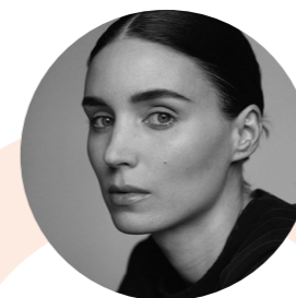
Rooney MARA Ambassadrice de la JIVEP Actrice américaine

Promouvons cette Journée internationale au nom de tous ceux qui, à travers l'Histoire, ont ressenti l'appel à faire de la Paix une réalité. »